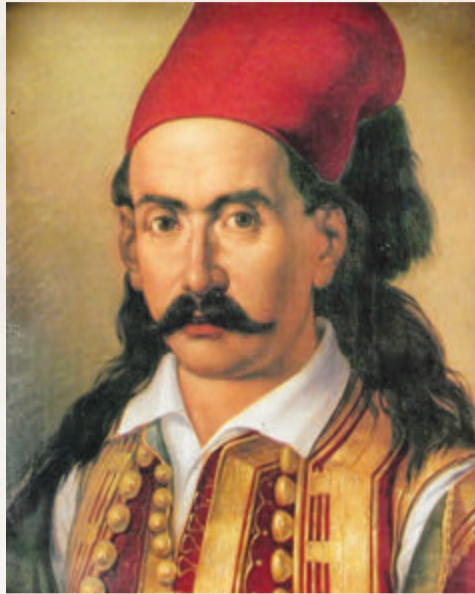
Η παλικαριά του Μάρκου Μπότσαρη του έδωσε ξεχωριστή θέση ανάμεσα στους αγωνιστές της Επανάστασης ( Αύγουστος 1823)

Ο Μάρκος Μπότσαρης, τότε, αφήνοντας κατά μέρος τις έριδες του ελληνικού στρατοπέδου, προσέβαλε με 350 Σουλιώτες την εμπροσθοφυλακή του Μουσταή, στο Κεφαλόβρυσο, κοντά στο Καρπενήσι. Ήταν οι μέρες που άρρωστος από φυματίωση ο Καραϊσκάκης απαντά στους Τούρκους πως φοβάται να προσκυνήσει και θα μείνει πιστός στο ντοβλέτι, αλλά δεν τα κατάφερε και,