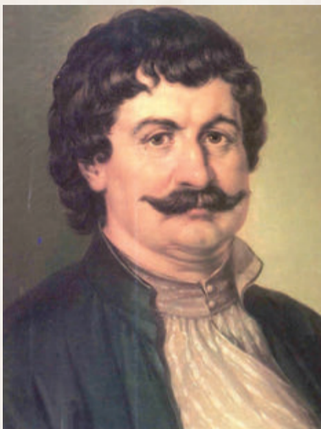
Μόνο αμελτέος δεν είναι ο ρόλος των Δασκάλων του Γένους, όπως ο Ρήγας Φεραίος.

λέει, με την ιδέα ίσως κινηθούμε δια τα εξω και λευτερωθούμε κι εμείς εδώ μέσα». Η λευτεριά θα έβγαινε μόνο απ' το χτύπημα και τη διάλυση της φεουδαρχίας».