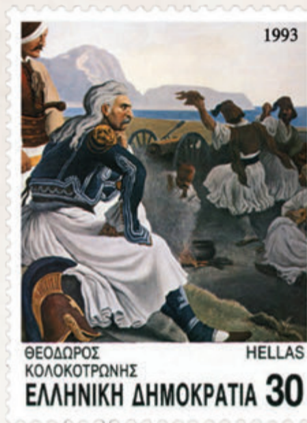
Ο Θεόδωρος Κολοκοτρώνης, χάρη στη στρατηγική του ιδιοφυΐα και το Δράμαλη (1822) νίκησε και τον Ιμπραήμ (1825) δυσκόλεψε, σε ώρες δύσκολες για τον Αγώνα

σε κάποιους εξ αυτών και προσπάθησε να τους εμψυχώσει με φλογερά λόγια.