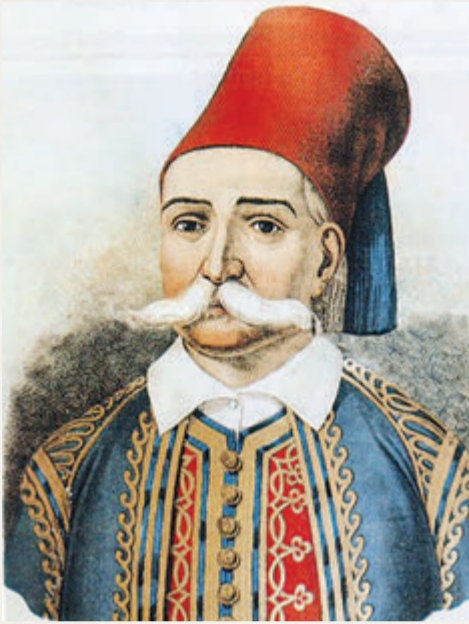
Πετρόμπεης Μαυρομιχάλης, τυπικός εκπρόσωπος των Πελοποννησίων προκρίτων

Ο ιστορικός Γ. Φίνλεϋ για το ίδιο θέμα σημειώνει: «Επικρατεί γενική γνώμη στην Ελλάδα ότι φθάνοντας στη Μονή της Αγίας Λαύρας οι προύχοντες και οι δεσποτάδες κηρύξαν την επανάσταση. Αυτό δεν είναι σωστό. Επιδίωκανε να καθουσιάζουν τις υποψίες των Τούρκων στα Καλάβρυτα και στη Βοστίτσα». Ο Ιω. Φιλήμων, εξάλλου, αποκαλεί την ιστορία της Αγίας Λαύρας «παχύλον ψεύδος», ενώ, τέλος, αξίζει να γραφεί πως και ο Σπυρίδων Τρικούπης αναφέρει ότι «Ψευδής είναι η εν την Ελ-