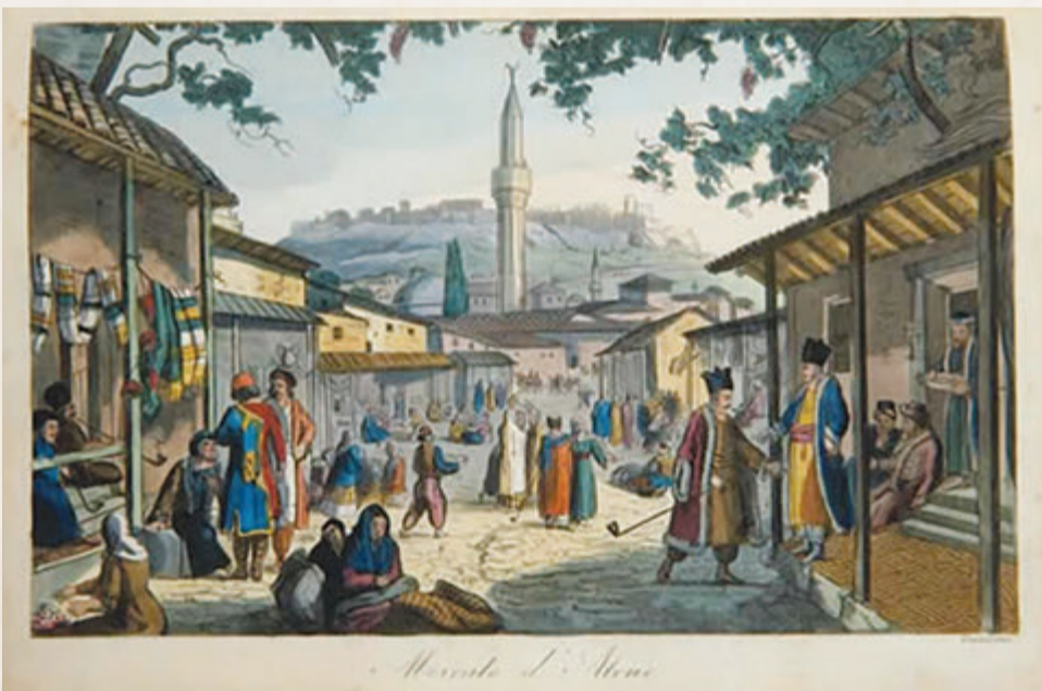
Η Επανάσταση του 1821 ήλθε να δώσει τέλος στη μακραίωνη τουρκική παρουσία στην Ελλάδα

Αμέσως μετά τη Βοστίτσα, ο Παπαφλέσσας ξεκινά εθνεγερτικές περιοδείες σ' όλο το Μοριά, έφτασε και στη Μάνη και έπεισε και τον Πετρόμπεη Μαυρομικάλη. Το επαναστατικό πνεύμα των μαζών θα «πυροδοτηθεί», όμως, κατά το β' μισό του Μάρτη της ίδιας χρονιάς. Από 15 έως 20 Μαρτίου, έχουμε τις πρώτες ένοπλες εκδηλώσεις της Επανάστασης, με πολιορκία και παράδοση των Καλα-