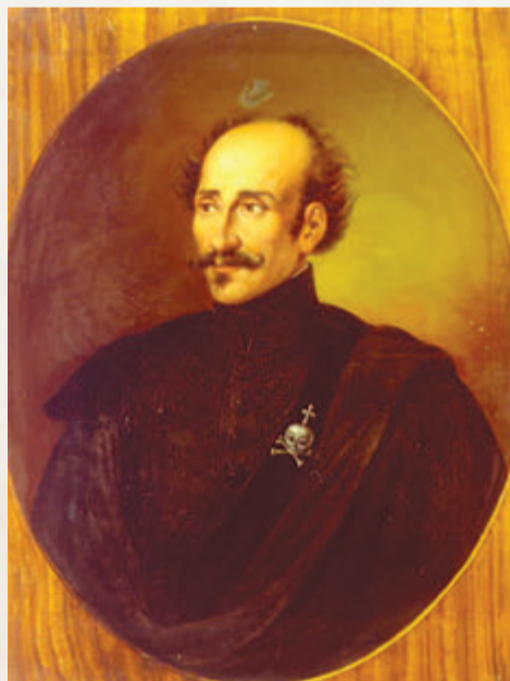
Ο Αλέξανδρος Υψηλάντης δίνει το έναυσμα για την Επανάσταση από τις Παραδουνάβιες ηγεμονίες

Όπως βλέπουμε στην «Ιστορική Ανθολογία» του Βλαχογιάννη, εκείνη τη μέρα (16.02.1821), στο σπίτι τους, στο Κισνόβιο, τέσσερα από τα πέντε αδέρφια Υψηλάντη, ο Αλέξανδρος, ο Δημήτρης, ο Νικόλας και ο Γιώργης, με τους δυο γραμματικούς τους, Γ. Λασσάνη και Γ. Τυπάλο, γράφουν την Προ-