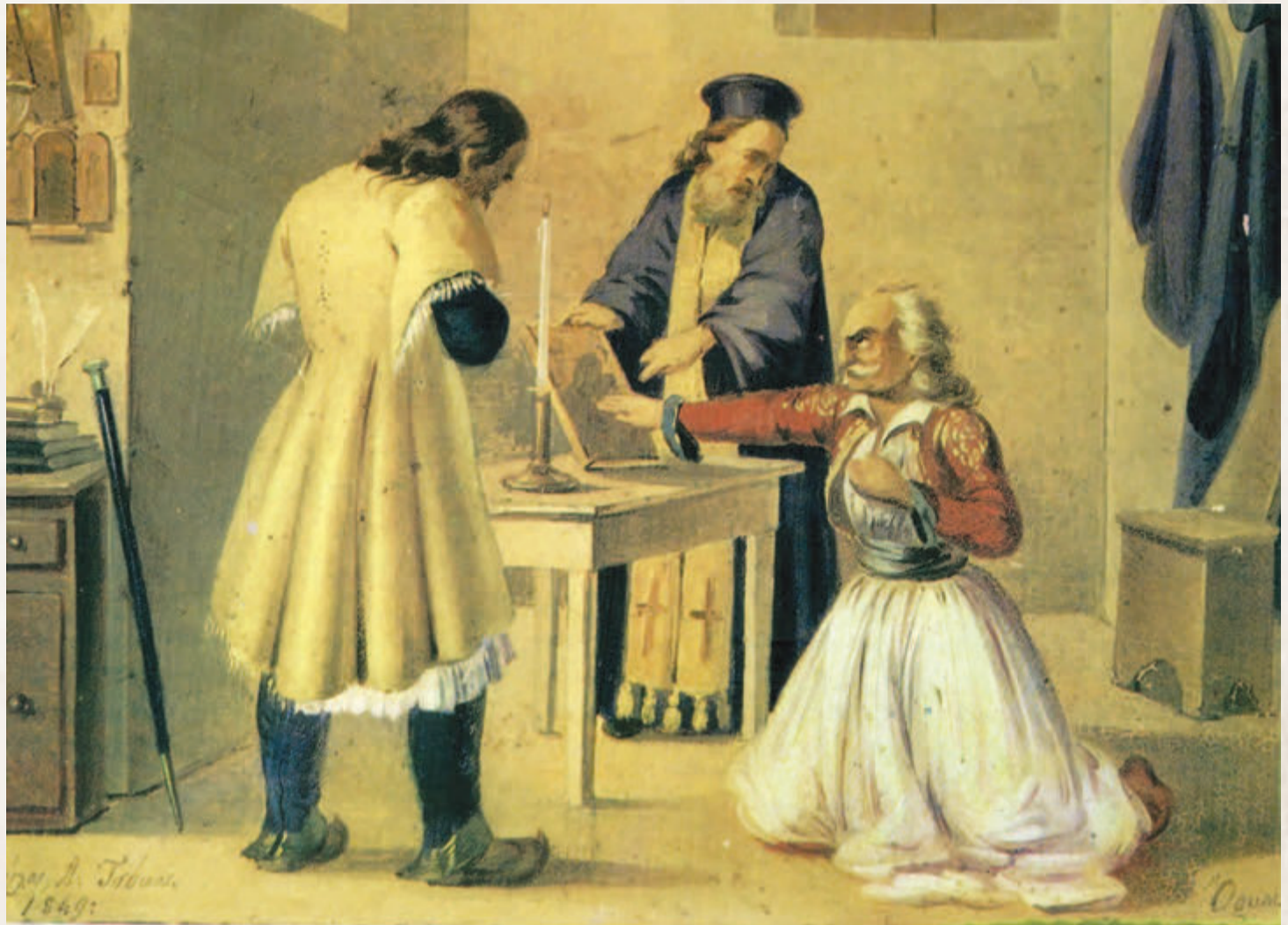
Τα μέλη της «Φιλικής Εταιρείας» δένονταν με απαραβίαστο όρκο

Ο Γ. Βαλέτας, όμως, καταθέτει την εξής άποψη για τη «Φιλική Εταιρεία»: «Η Φιλική Εταιρεία είναι γέννημα των αγώνων της Κλεφτουριάς και της Επανάστασης του 1803 - 1808. Στην αρχή ήταν Ιδεολογικό κίνημα. Με το κίνημα του Υψηλάντη και την αποτυχία του έδειξε την επαναστατική οργανωτική της ανεπάρκεια και την πολιτική της ανωριμότητα. Η Φιλική Εταιρεία δεν είχε εμπιστοσύνη στο λαϊκό κίνημα. Ανέκαθεν δούλεψε από τα πάνω. Η κυριώτερη προσφορά της είναι το πώς κατάφερε, να τραβήξει στην ιδέα της Επανάστασης πολλούς κορυφαίους του κλήρου, του φαναριωτισμού, των γραμμάτων, του εμπορίου». Και συμπληρώνει: «η Φιλική Εταιρεία έβαλε φωτιά στο καψούλι, χωρίς να ξέρει καλά-καλά αν θα ανάψει και με ποια αποτελέσματα. Το εθνεγερτικό έργο της ωστόσο είναι τεράστιο. Μόνο που