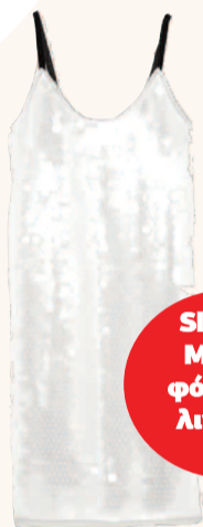
Sleeper Μαύρο φόρεμα - λιντζερί