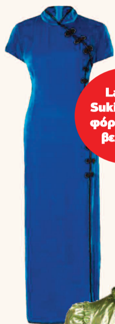
De La Valli Suki Μακρύ φόρεμα από βελούδο

Προτάσεις για όλα τα... βαλάντια παρουσιάζει η βρετανική έκδοση του "Vogue" για το ντύσιμο τα φετινά Χριστούγεννα. Τα αστραφτερά κρύσταλλα, τα φτερά και οι metallic υφές κυριαρχούν ενώ δεν λείπουν και οι αναφορές στα 80's.