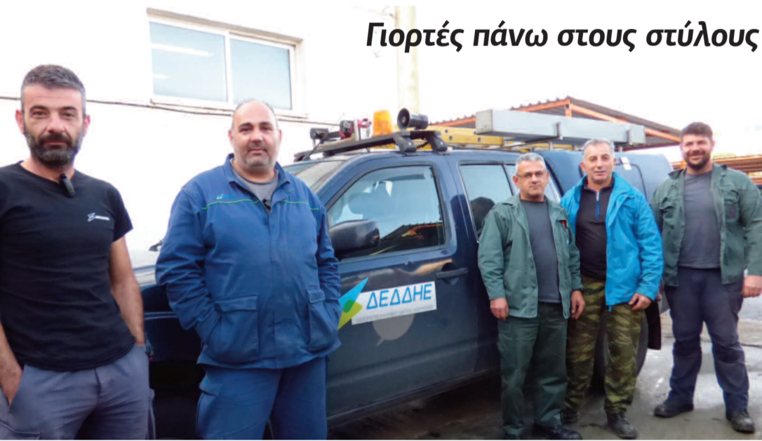
Οι αλλαγές του χρόνου και τα Χριστούγεννα πάνω σε στύλους είναι οικεία στους εναερίτες των Χανίων.

Κ ανείς δεν θέλει να μένει χωρίς ρεύμα, πόσο μάλλον τις γιορτές. Για να μην γίνεται αυτό τα συνεργεία του ΔΕΔΔΗΕ εργάζονται 24ώρες το 24ωρο προκειμένου να αποκαταστήσουν κάθε βλάβη.