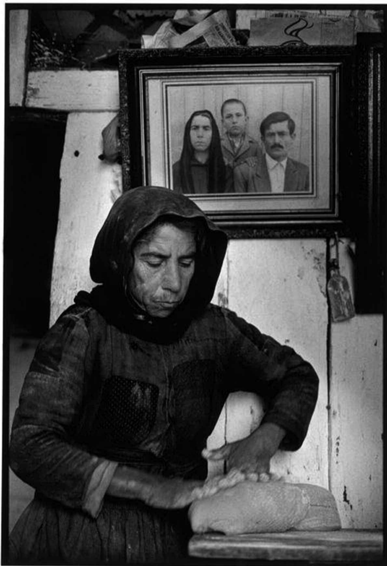
Κρήτη, 1964, φωτογραφία: Κωνσταντίνος Μάνος – Γυναίκα από Ελούντα πλάθει το ψωμί

N α! λέω με το νου μου η γι ευκαιρία να σεργιανίσω και πάλι τσοι περασμένους καιρούς. Τουτεσάς από τσοι γραφτούς κι άγραφους νόμους τσοι σέβονταν οι γι ανθρώποι και τσοι τπρούσαν κι ακλουθούσαν κατά γράμμα τα δασκαλέματα τση παράδοσης. Αναστορούμαι το λοιπός πως από τούτονέ το καιρό και πώδε στα ροζοναρίσματά ντωνε μικιοί και μεγάλοι στο' αποσπερίδες εσυζητούσανε για τσοι χριστουγεννιάτικες προετοιμασίες. Γι' αυτό και καθ' αργά εκαθίζανε ούλοι γύρου γύρου από τη χρεγγιά απούχανε για μαγκάλι κι ανταλλάσανε γνώμες και σκέψεις, κι αποφασίζανε τσοι δουλειές τση ταخينής. Τα σχολιαρούδικα βέβαια, κοντά στο λύχνω εδιαβάζανε τα μαθήματά ντωνε κι εγράφανε την αντιγραφή ντωνε. Τα πλια μικιά όμως, επιλατεύανε τη λάλη ντωνε, γη τη μάνα ντωνε, σαν εκαταστάλασσε από το αναμάζωμα και το πλύσιμο τω πιάτω, εν τω νει για το Χριστό απού σε κάμποσες μέρες θαν' εορτάζανε τη γέννησή ντου.