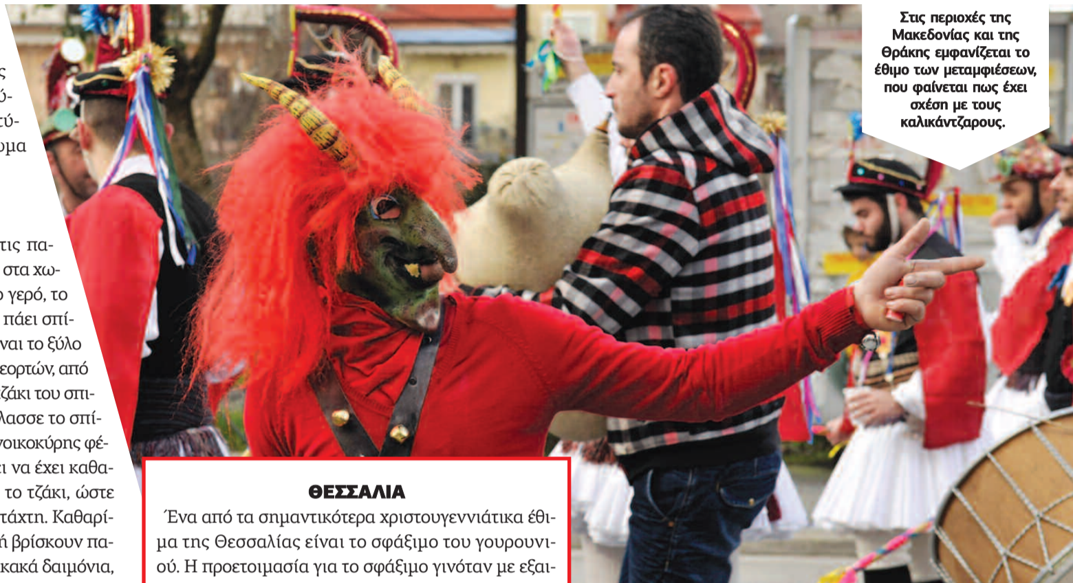
Στις περιοχές της Μακεδονίας και της Θράκης εμφανίζεται το έθιμο των μεταμφιέσεων, που φαίνεται πως έχει σχέση με τους καλικάντζαρους.

Στη Φλώρινα, οι κάτοικοι υποδέχονται τη γέννηση του Χριστού ανάβοντας μεγάλες φωτιές στις 12 τα μεσάνυχτα, που συμβολίζουν τη φωτιά που άναψαν οι ποιμένες της Βηθλεέμ για να ζεσταθεί ο νεογέννητος Χριστός. Φωτιές ανάβουν επίσης και το βράδυ της Πρωτοχρονιάς.