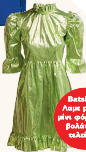
Batsheva Λαμε prairie μίνι φόρεμα με βολάν στο τελείωμα