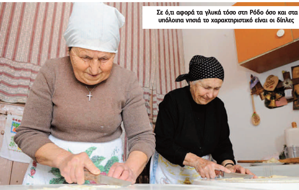
Σε ό,τι αφορά τα γλυκά τόσο στη Ρόδο όσο και στα υπόλοιπα νησιά το χαρακτηριστικό είναι οι δίπλες

Από τα αξιοσημείωτα των ημερών είναι ότι την ημέρα των Χριστουγέννων οι κάτοικοι της Ρόδου συνθηθίζουν να πηγαίνουν οικο-