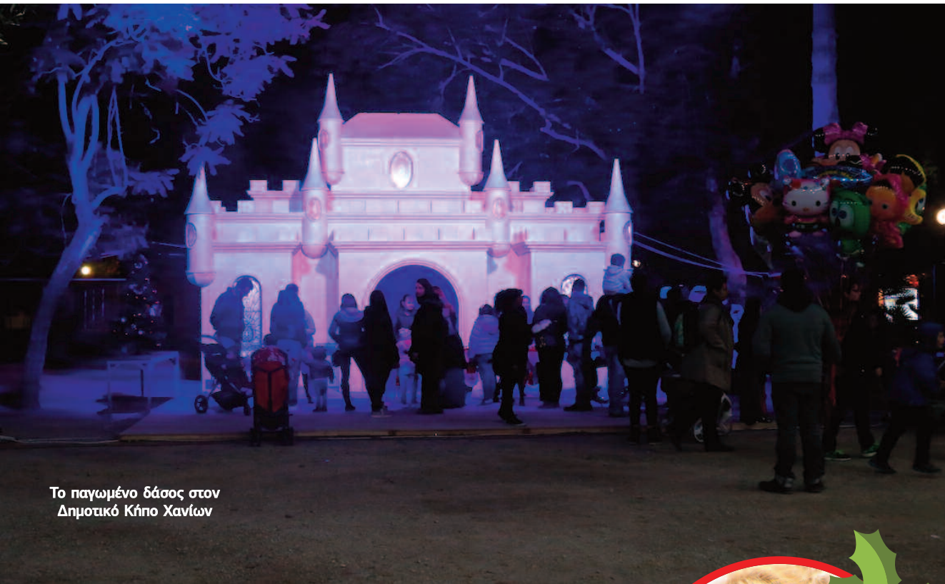
Το παγωμένο δάσος στον Δημοτικό Κήπο Χανίων