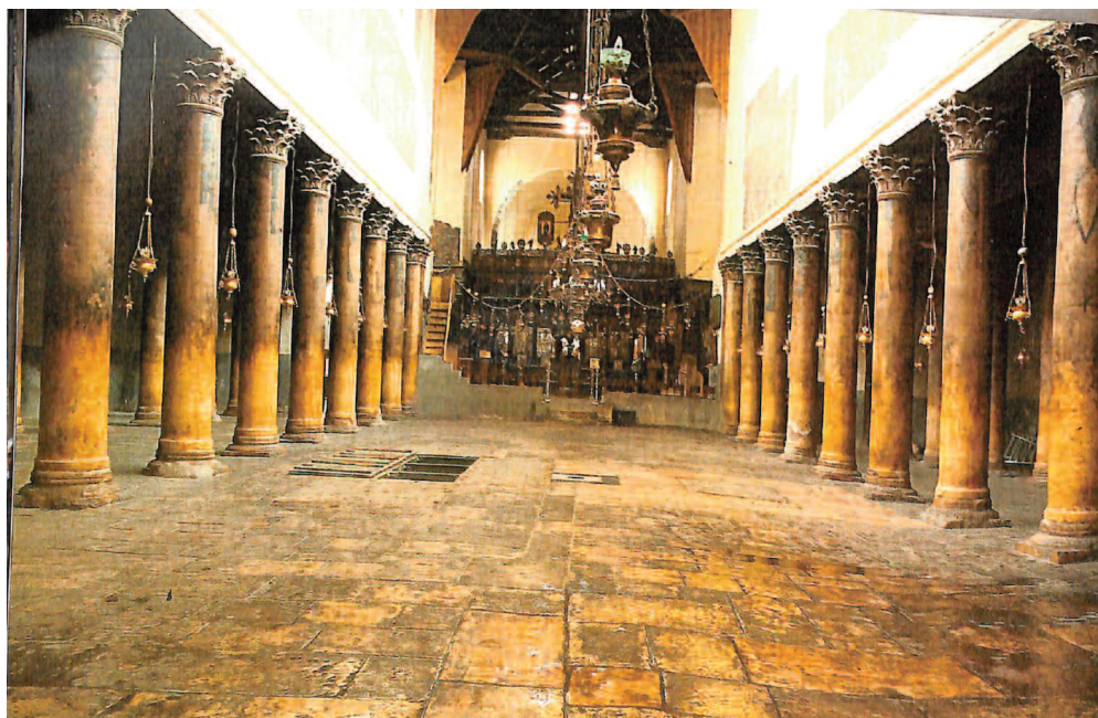
Το εσωτερικό του Ναού της Γέννησης.

νε για λίγο η Παναγία και όταν θύλαζε το θείο Βρέφος έπεσαν στον κόκκινο βράχο σταγόνες γάλακτος και ο βράχος άσπρισε. Τιμάται και από τους Μουσουλμάνους.