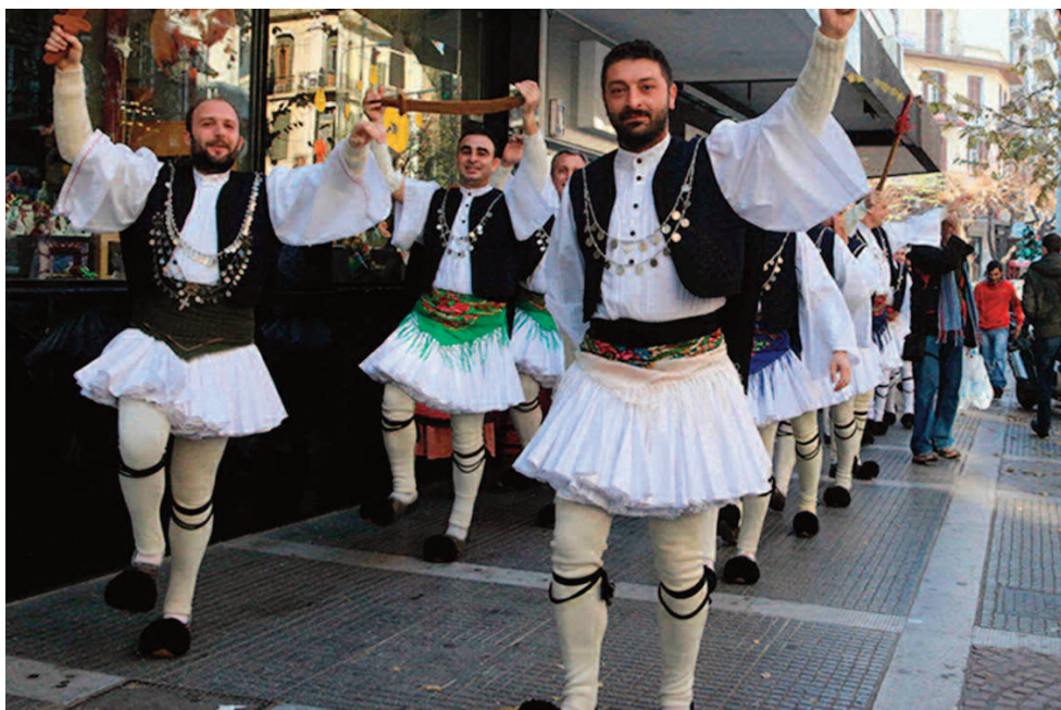
Ιδιαίτερο χαρακτηριστικό των Χριστουγεννιάτικων εθίμων της Μακεδονίας είναι οι μεταμφιέσεις που κατάφεραν να διατηρηθούν μέχρι σήμερα

μο προέρχεται από Πόντιους πρόσφυγες και η ονομασία του προέρχεται από τις λέξεις μίμος ή μώμος και γέρος. Οι πρωταγωνιστές του φορούν προβιές ζώων και μάσκες ενώ ιδιαίτερο είναι το ενδιαφέρον ενός δρώμενου όταν συναντώνται διαφορετικές ομάδες μωμόγερων που οφείλουν να αντιπαρατεθούν σε μια μάχη όπου θα κερδίσει ο καλύτερος και ο χαμένος θα δηλώσει υποταγή.