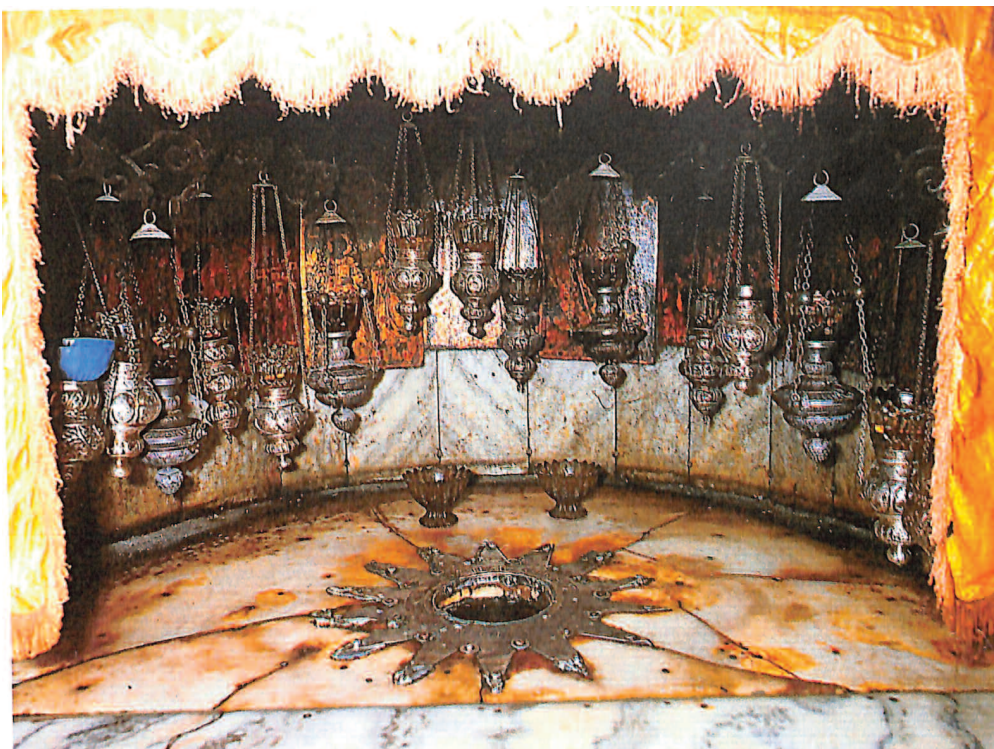
Στο σπήλαιο της Γέννησης.

Σε παράπλευρους χώρους, υπάρχουν νεώτερα κτίσματα των Λατίνων κλπ., δογμάτων. Δυτικά του ναού, σε μορφή κατακόμβης, υπάρχει το σπήλαιο των σφαιγιασθέντων από τον Ηρώδη 14.000 νηπίων ενώ μέσα στα αρκετά άλλα εξωτερικά προσκυνήματα όπως η Μονή του Αγίου Ιερώνυμου υπάρχει και το Σπήλαιο του Γάλακτος, όπου, κατά την παράδοση, έμει-