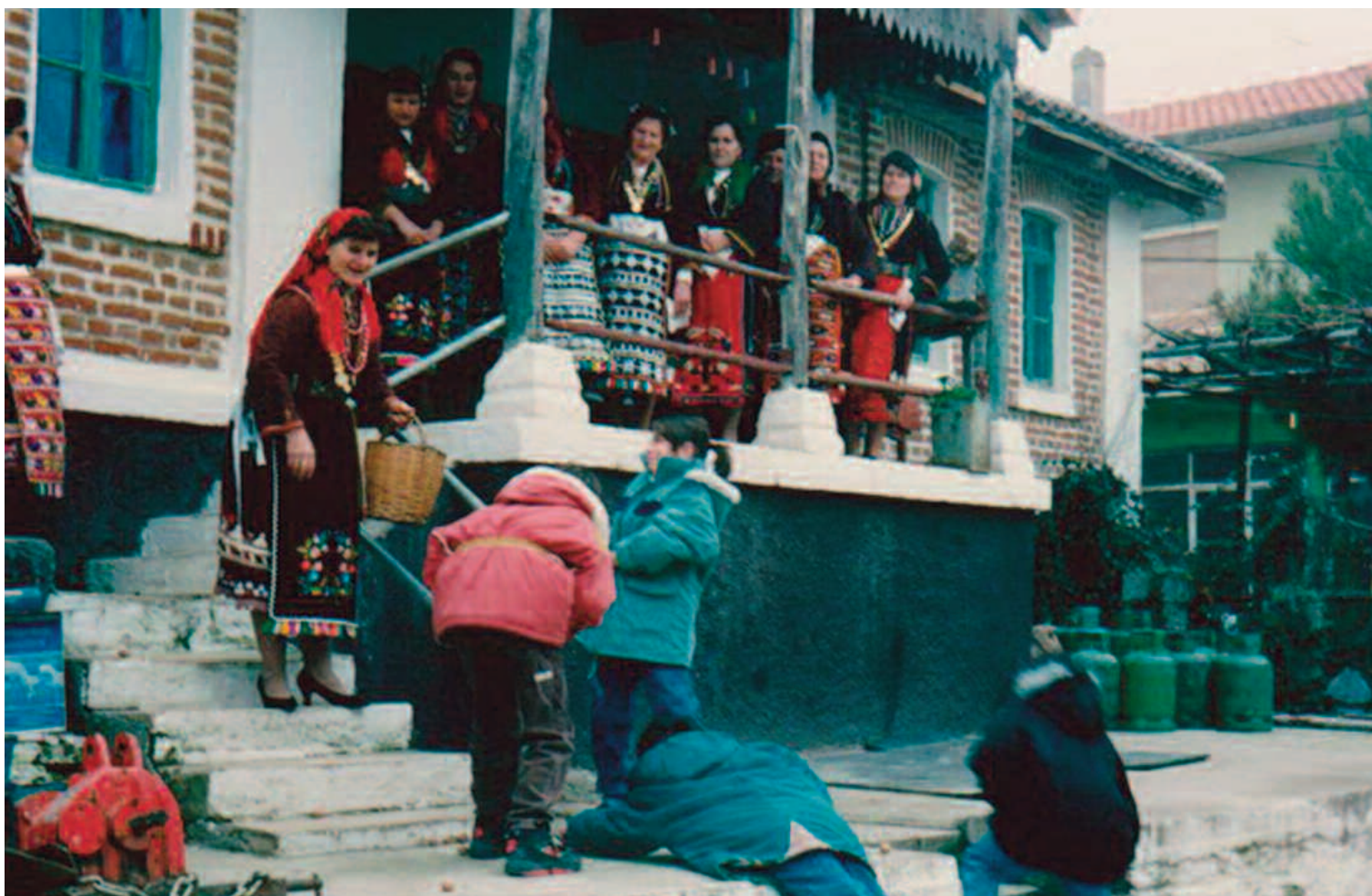
Τα κόλιαντα πχούν από τους μικρούς καλαντιστές από νωρίς το πρωί της παραμονής των Χριστουγέννων έως και το μεσημέρι