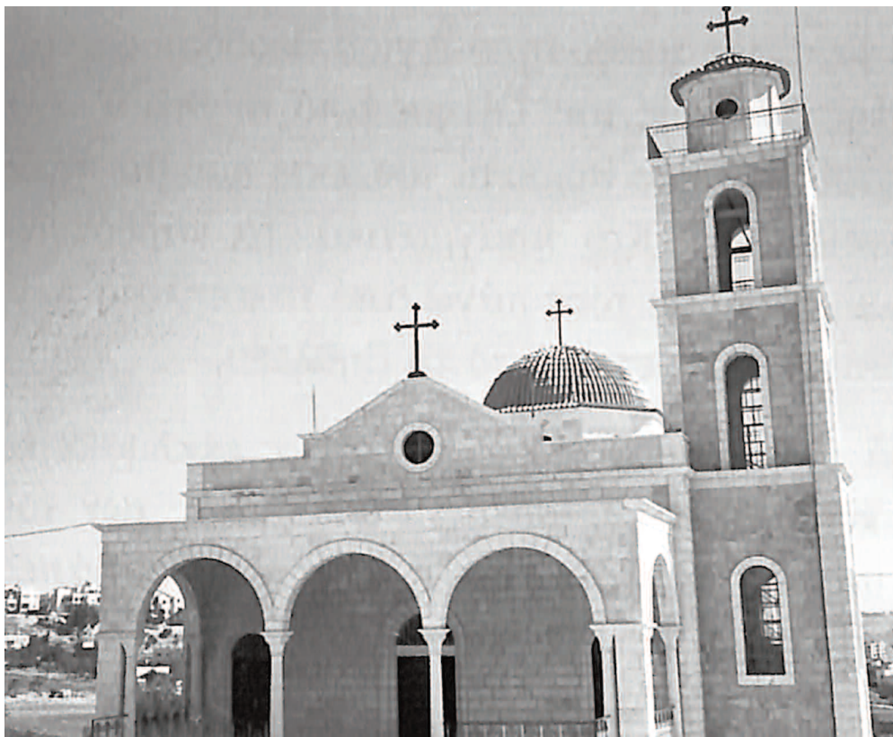
Ο ναός στο Μπετσακούρ με ξυλόγλυπτο τέμπλο. (Καβρουλάκη από Χανιά)