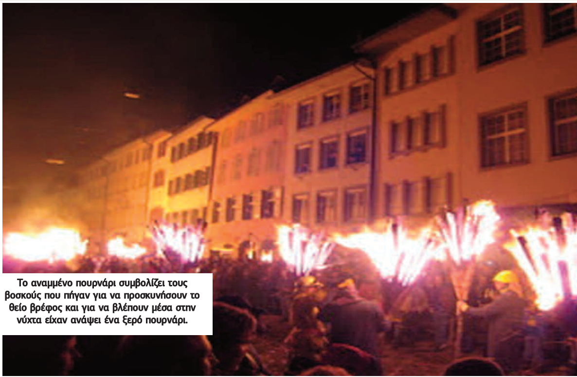
Το αναμμένο πουρνάρι συμβολίζει τους βοσκούς που πήγαν για να προσκυνήσουν το θείο βρέφος και για να βλέπουν μέσα στην νύχτα είχαν ανάψει ένα ξερό πουρνάρι.

τελούν τροφή για ζώα και ανθρώπους, γι' αυτό το φαγητό, συμβολίζει την επάρκεια των αγαθών στο κάθε σπίτι. Σύμφωνα με την παράδοση η Παναγία, βρήκε αυτή την τροφή κοντά στην φάτνη για να φάει, γι' αυτό είναι το ευλογημένο των Καππαδόκων φαγητό της προσφοράς και το μοιράζουν.