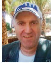
Του Γ. Η. Ορφανού

Κ άθε Χριστούγεννα, από τα παιδικά μου χρόνια ήδη, περνούν από το μυαλό μου χιλιάδες σκέψεις. Σκέψεις που συνοδεύονται με ευχές για να φέρει ο γεννώμενος Χριστός ειρήνη, γαλήνη και αγάπη στον κόσμο.