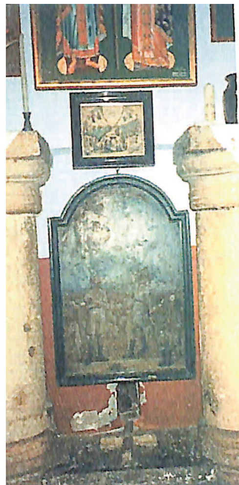
Το σπήλαιο των Ποιμένων.

Μόλις ένα χιλιόμετρο από την πόλη, ευρίσκεται το χωριό των Ποιμένων, το Μπετσακούρ στα Αραβικά, όπου οι ταπεινοί βοσκοί πρώτοι άκουσαν τον δοξολογικό