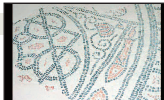
Οι τοιχογραφίες στο εσωτερικό του ναού είναι οι μοναδικές του 6ου αιώνα μ.Χ. που διασώζονται σε ολόκληρη την Κρήτη, ενώ και τα ψηφιδωτά υποβάλλουν τον επισκέπτη του ναού.

Ξεχωριστή θέση σε ό,τι αφορά τα βυζαντινά μνημεία στην Κρήτη κατέχει ο παλαιοχριστιανικός ναός του Μιχαήλ Αρχαγγέλου (Ροτόντα) στην Επισκοπή Κολυμπαρίου. Η παλαιότητα της εκκλησίας αλλά και η σπανιότητα του αρχιτεκτονικού μνημείου -καθώς είναι μια από τις 3 μόλις Ροτόντες που διασώζονται στα Βαλκάνια- την καθιστά πόλο έλξης για Έλληνες και ξένους επισκέπτες που θέλουν να προσκυνήσουν και να γνωρίσουν από κοντά τον ναό. Τα σπαράγματα από τις τοιχογραφίες και του ψηφιδωτού στο πάτωμα υποβάλλουν αμέσως τον επισκέπτη. Ανάμεσα στις εικόνες των Αγίων Αικατερίνης, Γεωργίου, Πέτρου, Κωνσταντίνου κ.ά. ξεχωρίζουν ο Μυστικός Δείπνος και ο Γάμος στην Κανά αλλά και μια σπάνια εικόνα της Αγίας Άνας που θηλάζει την Παναγία. Εξίσου εμβληματική η Αγία Τράπεζα που χρο-