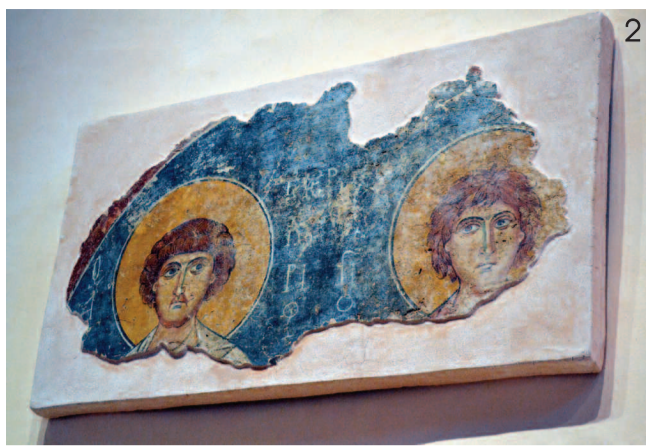
2 Ένα από τα λίγα έργα του 11ου αιώνα που σώζονται μέχρι τις ημέρες μας αποτελούν οι τοιχογραφίες που βρέθηκαν στη βυζαντινή εκκλησία της Αγίας Βαρβάρας στα Λατζιανά Κισάμου.