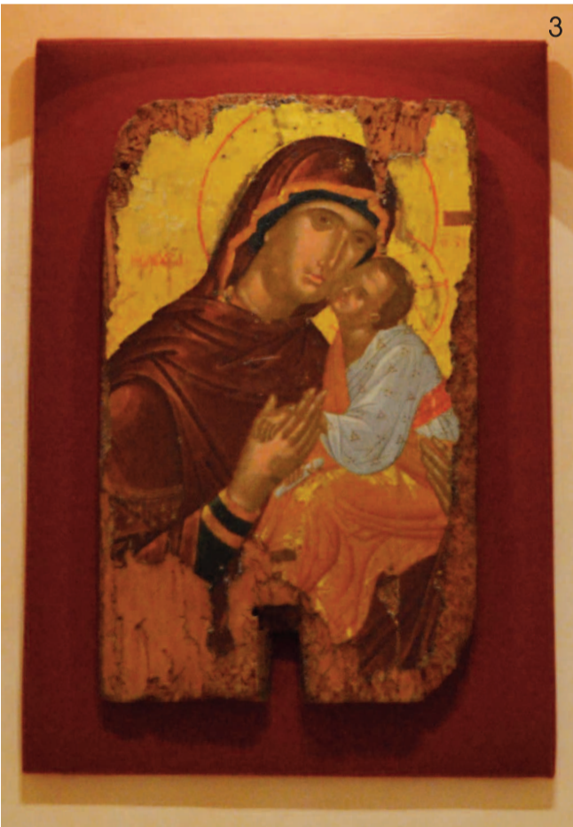
3 Η Παναγία Ελεούσα από τους Αγίους Πάντες Αποκορώνου χρονολογείται από τον 15ο αιώνα.

«Σε κάθε περίπτωση, η Βυζαντινή Συλλογή αν και περιορισμένη λόγω έλλειψης χώρου δίνει στον επισκέπτη ερεθίσματα για να γνωρίσει βαθύτερα τον πολιτισμό της χριστιανικής περιόδου στον Ν. Χανίων. Το σίγουρο είναι ότι σε όλες τις περιόδους ο νομός παρουσιάζει μια άνθηση κι ένα επίπεδο υψηλότερο από το μέσο της εποχής. Από εκεί και πέρα αυτά που παρουσιάζονται στη Συλλογή είναι ένα μικρό αλλά αντιπροσωπευτικό μέρος από αυτά που υπάρχουν στις αποθήκες της Εφορίας Αρχαιοτήτων και που ίσως στο μέλλον σε έναν μεγαλύτερο χώρο δοθεί η δυνατότητα να εκτεθούν», επεσήμανε ο κ. Ανδριανάκης.