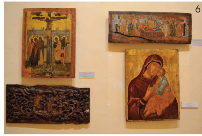
3 Αριστερά πάνω διακρίνεται η εικόνα της Σταύρωσης που εικάζεται ότι ζωγράφησε το πρώτο μισό του 17ου αιώνα ο Εμμανουήλ Σκορδίλης.