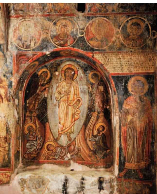
Η δεσποτική εικόνα - τοιχογραφία του ναού στα Μεσκλά όπου μέχρι σήμερα οι κάτοικοι του οικισμού ανάβουν κεριά μπροστά από την τοιχογραφία την ημέρα της εορτής της Μεταμόρφωσης.

Στη συνέχεια υπάρχει ένα στρώμα ζωγραφικής από την εποχή της εικονομαχίας (9ος αιώνας), ακολουθούν τοιχογραφίες του 12ου αιώνα της εποχής των Κομνηνών που θεωρούνται επίσης μοναδικές και ένα ακόμα στρώμα ζωγραφικής του 14ου αιώνα, έργο του Μιχαήλ Βενέρη».