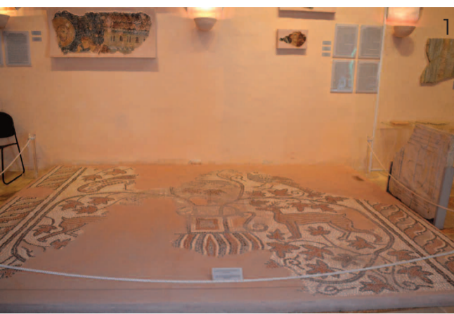
1 Το ψηφιδωτό που εκτίθεται στη Βυζαντινή Συλλογή Χανίων αποτελεί δείγμα της άνθησης που γνώρισε η βυζαντινή τέχνη στα Χανιά.