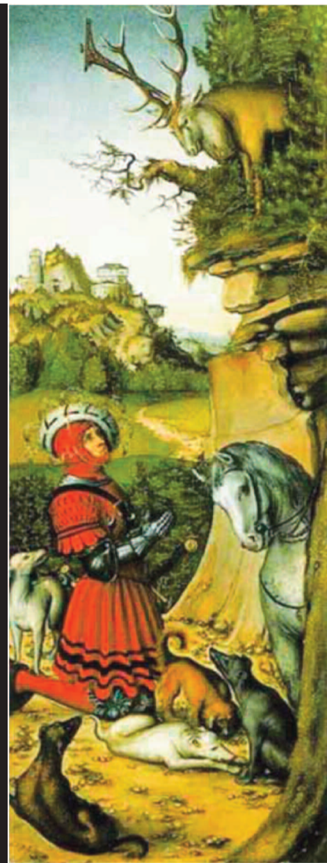
Λούκας Κράναχ ο Πρεσβύτερος (Lucas Cranach d.), “Το όραμα του Αγίου Ευσταχίου ή του Αγίου Χουμπέρ”, γύρω στα 1515-1520, Συλλογή του δούκα του Λίχτενσταίν.