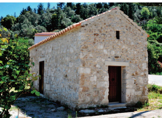
Ο Ιερός Ναός της Μεταμόρφωσης του Σωτήρος στα Μεσκλά προσφέρει στον επισκέπτη - προσκυνητή δείγματα της υψηλής βυζαντινής τέχνης που αναπτύχθηκε στη δυτική Κρήτη.