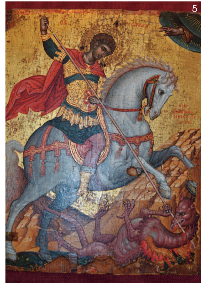
5 Ο Άγιος Γεώργιος Εφιππος Δρακοντοκτόνος έργο του ζωγράφου Εμμανουήλ Τζάνε (1660-1680).