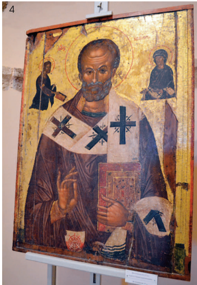
4 Ο Άγιος Νικόλαος από τον Δραπανιά Κισάμου χρονολογείται από στα τέλη του 14ου αιώνα.