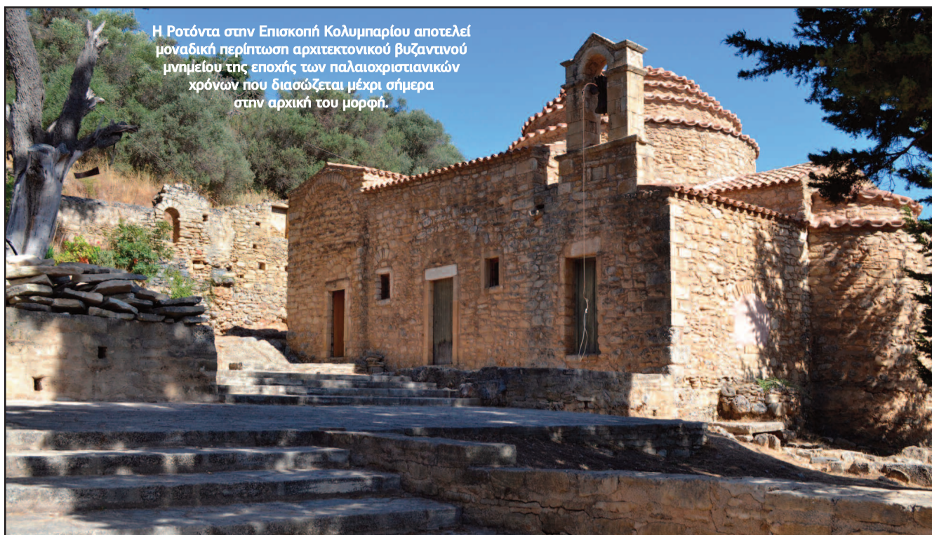
Η Ροτόντα στην Επισκοπή Κολυμπαρίου αποτελεί μοναδική περίπτωση αρχιτεκτονικού βυζαντινού μνημείου της εποχής των παλαιοχριστιανικών χρόνων που διασώζεται μέχρι σήμερα στην αρχική του μορφή.