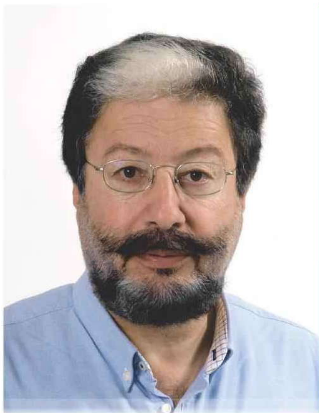
Μιχάλης Κριτσωτάκης Υπ. Περιφερειάρχης Κρήτης